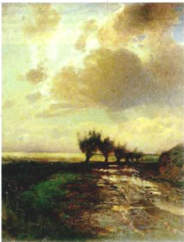
Алексей Саврасов. Просёлок. 1873 г. Государственная Третьяковская галерея, Москва.