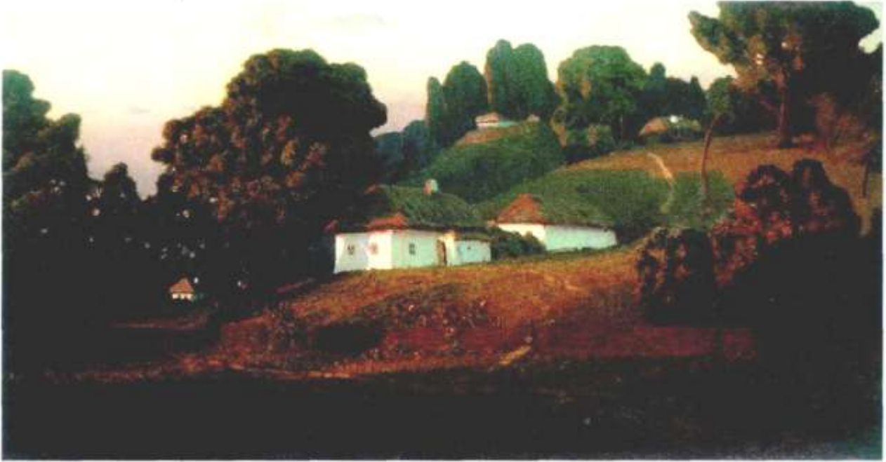
Архип Куинджи. Вечер на Украине. 1878 г. Государственный Русский музей, Санкт-Петербург.

На первом плане изображены не деревья целиком, а только гибкие белые стволы. Позади них — силуэты кустов и деревьев, а вокруг — изумрудная зелень болота с прогалиной, полной тёмной воды.