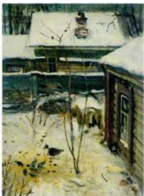
Алексей Саврасов. Дворик. Зима. Конец 70-х гг. XIX в. Государственная Третьяковская галерея, Москва.

Иван Иванович Шишкин (1832— 1898) родился в городе Елабуге в семье образованного и влиятельного купца. После окончания Московского училища живописи, ваяния и зодчества, а затем Академии художеств в Петербурге (с Большой золотой медалью) он был отправлен в поездку по Европе. В Германии Шишкин завершил обучение и стал академиком. Точность рисунка, суховатая живопись и пристрастие к монументальным композициям выделяют его среди других русских пейзажистов.